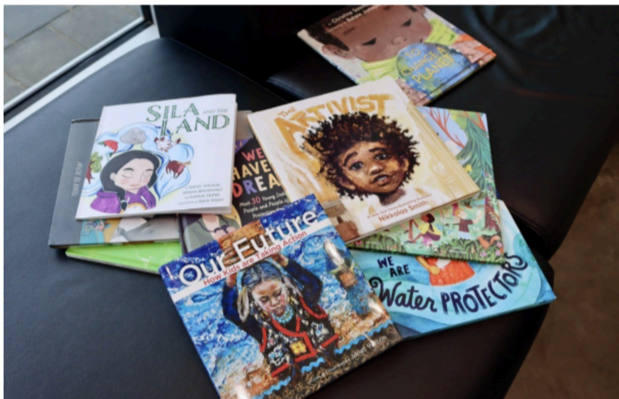
de certains livres d'images.

Sur la base des résultats, une liste de livres d'images a été créée. Cette liste répond à la demande de ressources ECC pour soutenir l'enseignement et l'apprentissage des changements climatiques et sera largement diffusée lorsqu'elle sera finalisée. Les résultats de cette recherche seront publiés dans une revue à comité de lecture et présentés lors d'une conférence universitaire. La bibliothèque de livres d'images achetée grâce à la subvention Accelerate est utilisée dans les TEP de VIU pour initier les enseignants en formation aux principes de l'accord et aux pédagogies et pratiques relatives aux changements climatiques.