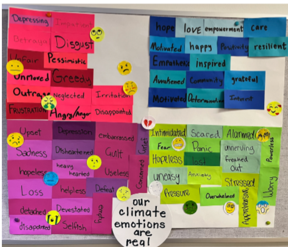
Un artefact d'apprentissage créé par les enseignants en formation du VIU dans le cadre de mon cours avant de passer en revue l'un des livres d'images de la collection. L'objectif de cette activité était de créer des espaces sûrs pour reconnaître toutes les émotions climatiques (c'est-à-dire les meilleures pratiques de l'ECC).

Résultats pédagogiques : L'échantillon de 159 livres et un ensemble de Sila and the Land ont déjà été intégrés dans des activités d'apprentissage basées sur les cours. Sila and the Land est un livre qui a obtenu un score très élevé sur plusieurs principes de l'Accord et qui représente une vision du monde indigène au sens large (c'est-à-dire que les enseignements ne sont pas spécifiques à un territoire ou à un lieu). La bibliothèque de livres d'images, rendue possible grâce à la subvention Accelerate, a été utilisée dans le cadre du VIU TEP ce trimestre pour initier les enseignants en formation aux principes de l'Accord et aux pédagogies et pratiques de l'ECC. Les livres ont été d'une aide précieuse pour ancrer des discussions importantes (par exemple, l'anxiété climatique, les mécanismes d'adaptation constructifs, l'évaluation critique des ressources éducatives, l'identification des marqueurs textuels de l'espoir, les préceptes communs d'une vision du monde indigène, la conception de projets d'action en classe, etc.).