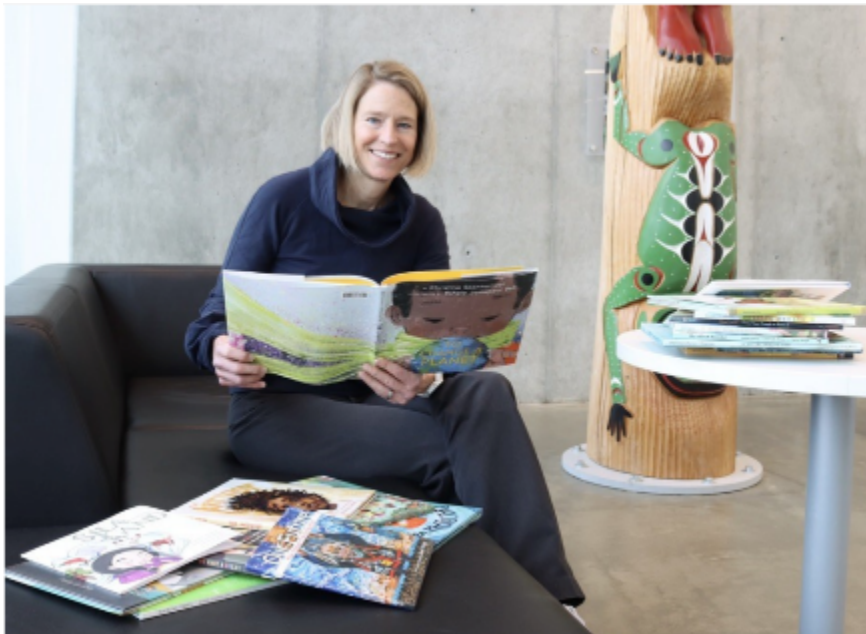
Une photo prise par Annette Lucas pour un article de VIU "Expert Commentary" qui sera publié sur le site web de VIU au cours du mois prochain.

Défi important : En tant que chercheur non autochtone, honorer et respecter les façons autochtones de connaître, d'être et de faire (l'un des principes de l'Accord) au sein des systèmes et des structures dans lesquels la recherche universitaire est intégrée s'est avéré difficile. Nous avons fait de notre mieux pour mener cette recherche d'une "bonne manière" (par exemple, un chercheur autochtone a fait partie de l'équipe d'étude, nous avons veillé activement à ce que les ressources authentiques des Métis, des Premières nations et des Inuits soient représentées, nous avons reçu des enseignements des aînés, nous avons fait une déclaration sur le positionnement). Cependant, beaucoup d'entre nous ont le sentiment que l'évaluation des livres en fonction de la visibilité des points de vue autochtones va à l'encontre du principe même de .... (voir ci-dessous).