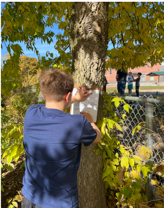
Figure 3 : Élève dans le jardin utilisant un presse-papiers pour dessiner, étiqueter et décrire les plantes indigènes du jardin.