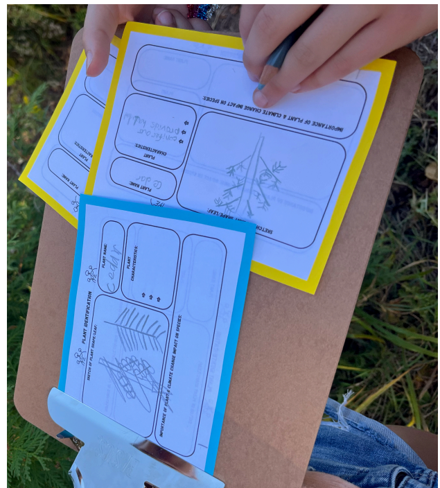
Figure 4 : Travail d'un élève présentant des dessins de feuilles de plantes indigènes, une description de la plante et l'impact des changements climatiques sur cette espèce.