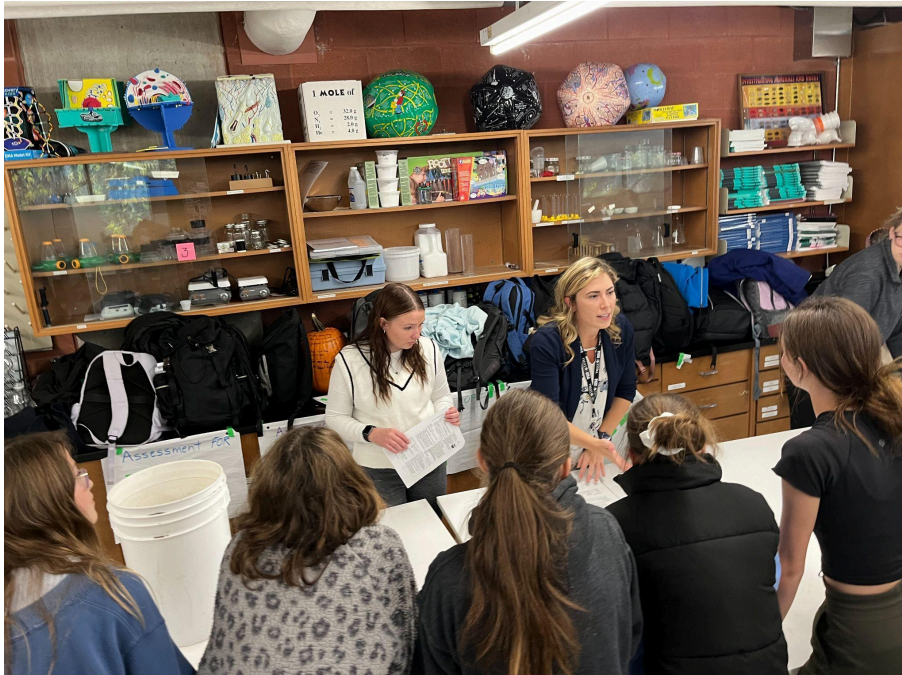
Figure 2. Cette image montre des enseignants en formation qui répondent à des questions et expliquent aux élèves une station de sciences du sol. Les enseignants en formation utilisent des questions ouvertes et modélisent des stratégies d'apprentissage basées sur l'investigation afin de susciter l'intérêt des élèves pour les sujets abordés, de répondre aux idées fausses et de renforcer la confiance en soi.

au fait que nous n'avons pas toutes les réponses et proposer à nos élèves un modèle d'apprentissage basé sur la recherche. Dans l'atelier sur les sciences du sol, les élèves et les enseignants en formation ont réfléchi ensemble aux questions, en établissant des liens avec le monde réel (Fig. 2). Cette approche aide non seulement les élèves à s'impliquer activement dans les concepts, mais elle contribue également à renforcer notre confiance en tant qu'éducateurs. Les questions ouvertes et les approches d'apprentissage basées sur l'investigation encouragent la curiosité des élèves et leur permettent de poser des questions. Cette approche collaborative permet aux étudiants et aux éducateurs d'être des partenaires actifs de l'apprentissage et favorise une compréhension plus profonde lorsqu'ils sont confrontés à des idées fausses sur des sujets complexes tels que l'ECC et l'EED.