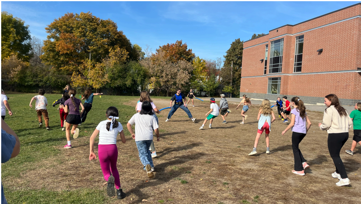
Figure 1. Cette image montre des étudiants et des enseignants en formation se livrant à un jeu d'apprentissage kinesthésique intitulé "Espèces invasives contre espèces indigènes", dans lequel les espèces indigènes devaient traverser le champ pour aller chercher leur nourriture et revenir avant d'être marquées avec une nouille par une espèce invasive. Cette activité a favorisé l'apprentissage actif, a contribué à renforcer les concepts appris et a encouragé la collaboration entre les étudiants et les enseignants en formation.

En réfléchissant aux leçons, il est apparu clairement qu'une approche plus équilibrée était nécessaire, car de nombreuses leçons commençaient par être trop chargées d'informations. Après la première leçon, il est apparu clairement que les étudiants s'impliquaient davantage dans les activités pratiques que dans l'apprentissage magistral. Les fiches de sortie ont confirmé que les élèves renaient davantage d'informations grâce à l'apprentissage par l'expérience et qu'ils étaient enthousiasmés par le contenu qu'ils apprenaient. Par exemple, grâce à l'apprentissage par l'expérience, nous avons constaté que les élèves étaient très enthousiastes lors d'un jeu de rôle sur le cycle du carbone, ce qui leur a permis d'établir des liens personnels plus profonds avec la façon dont le carbone nous aide à grandir. Ce groupe d'élèves a ensuite discuté des aliments qui contiennent le plus de carbone pour leur permettre de devenir grands et forts. De manière inattendue, notre discussion de groupe a fini par explorer les aliments sains, à forte teneur en carbone, et la durabilité de l'alimentation, sous l'impulsion des enseignants en formation. À l'avenir, nos leçons continueront à se concentrer davantage sur l'apprentissage kinesthésique et expérimental, avec des explications plus courtes et davantage d'opportunités de s'engager dans les concepts de manière significative, afin d'améliorer globalement l'intérêt et la rétention des élèves.